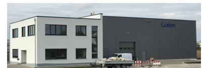
Luxion AG bei München